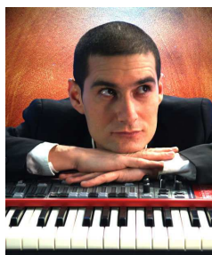
Au Glacier Lionel Dandine